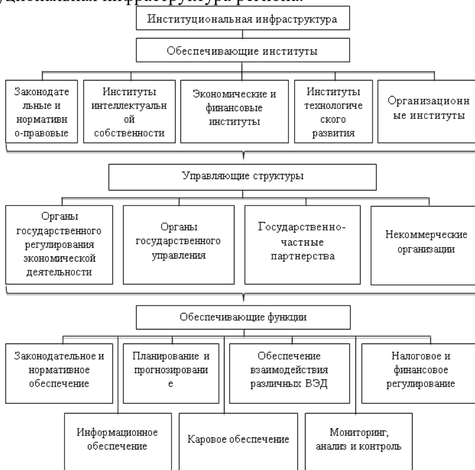
Рисунок 1 – Институциональная инфраструктура региона

Таким образом, институциональная инфраструктура характеризует, регулирует, закрепляет и представляет собой нормативное обеспечение инновационной деятельности, как макро-, так и микроэкономическом уровнях, в целях содействия и формирования условий для инновационного развития регионального хозяйства. На рисунке 1 представлена институциональная инфраструктура региона.