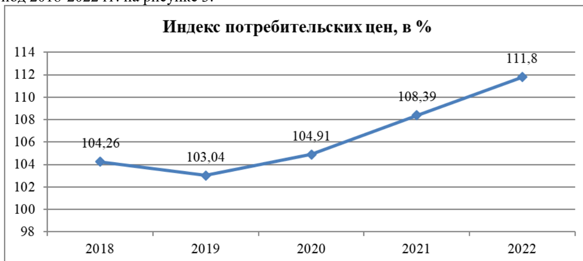
Рисунок 4 – Индексы потребительских цен на товары и услуги в РФ 2018-2022 гг., %

Далее рассмотрена динамика индексов потребительских цен в Российской Федерации в период 2018-2022 гг. на рисунке 3.