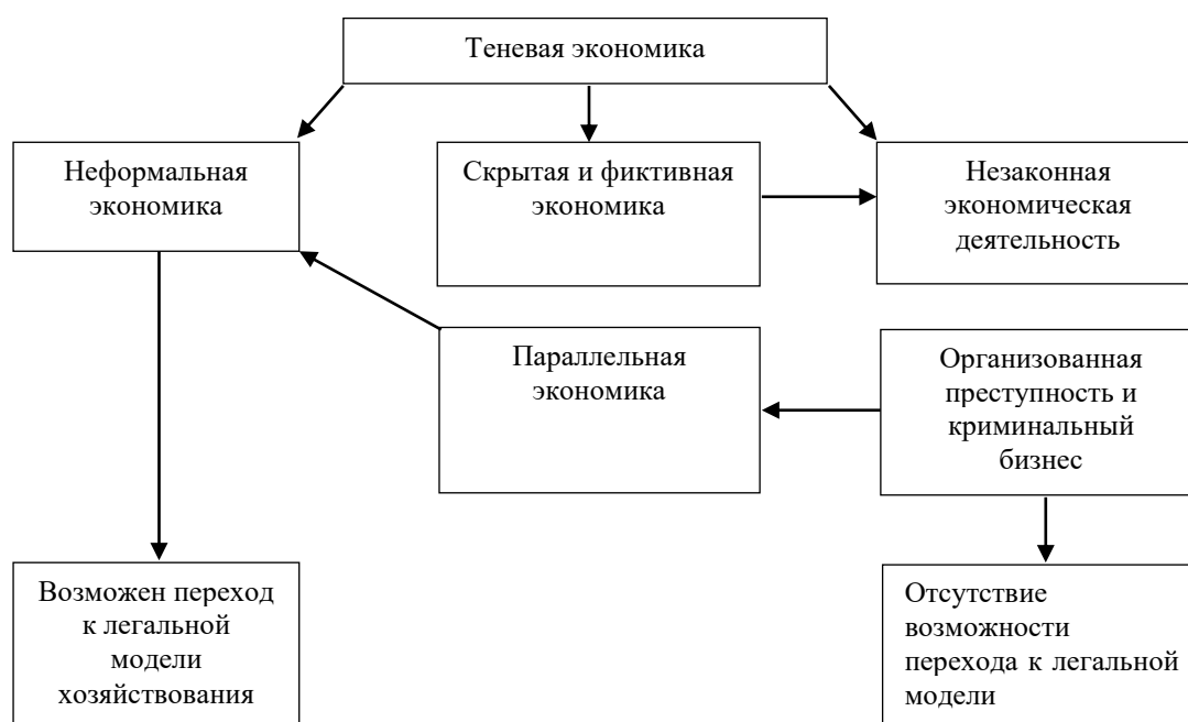
Рисунок 1 – Структурная схема теневой экономики

Далее встает вопрос определения структуры феномена. Есть несколько позиций касаясь этого. Первая – классическая и общепринятая, отразим ее на схеме ниже (Рисунок 1).