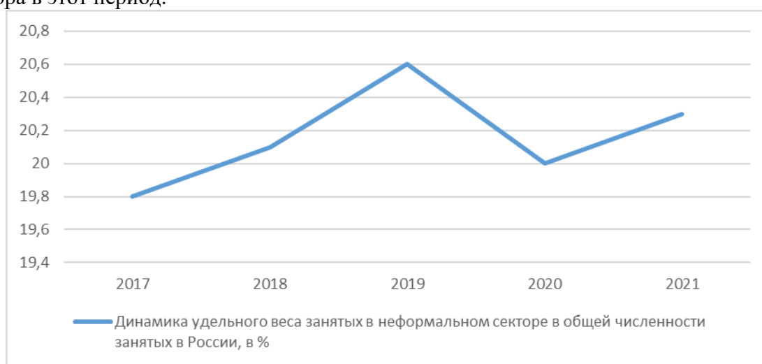
Рисунок 2 - Динамика удельного веса занятых в неформальном секторе в общей численности занятых в России, в % [6]

Далее рассмотрим данные статистики касательно показателей теневой экономики в Российской Федерации. Для начала рассмотрим такой показатель, как динамика удельного веса занятых в неформальном секторе в общей численности занятых в России, в % в разрезе 2017-2021 годов, что может являться показателем объема реального теневого сектора в этот период.