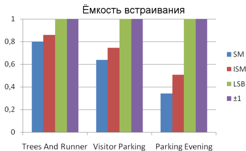
Рис. 1. Ёмкость встраивания (бит на отсчет)

На рис. 1 представлены диаграммы ёмкости встраивания (количество бит встраиваемого сообщения на отсчет видеопоследовательности). Для исследуемых методов SM и ISM эти значения меньше единицы из-за ограничений метода и зависят от параметров шума.