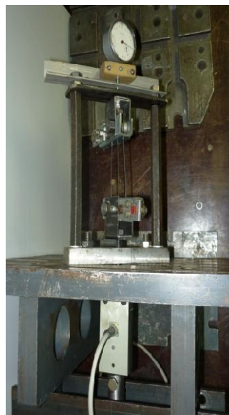
Рис. 2. Экспериментальный образец силопривода

Получены деформационно-силовые характеристики. Проведённые эксперименты подтвердили факт суммирования усилий. В качестве метода нагрева использовался электронагрев непосредственным пропусканием тока через элемент. Показаны примеры использования многозвенных силоприводов в технике.