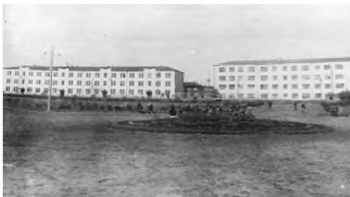
Бывшее городское кладбище. Будущий парк Щорса