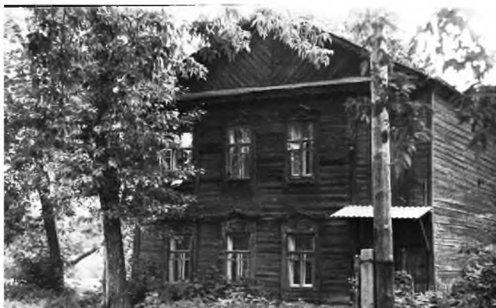
Красинская улица на фотографиях конца 1950-х–1960-х гг.