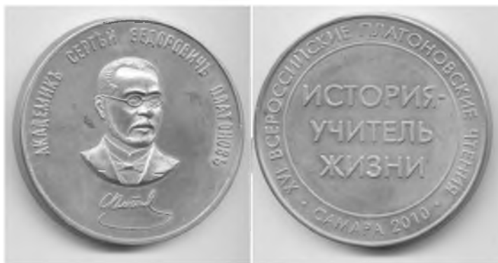
Медали для лауреатов и победителей секций