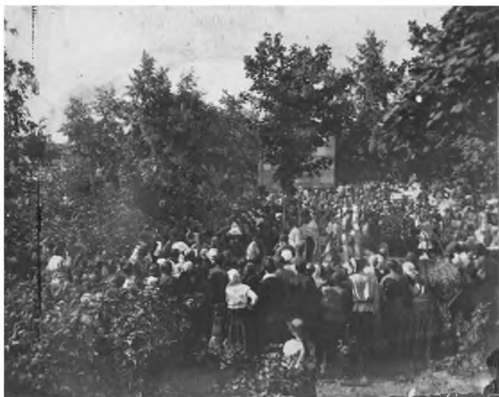
Всесвятское кладбище в Самаре