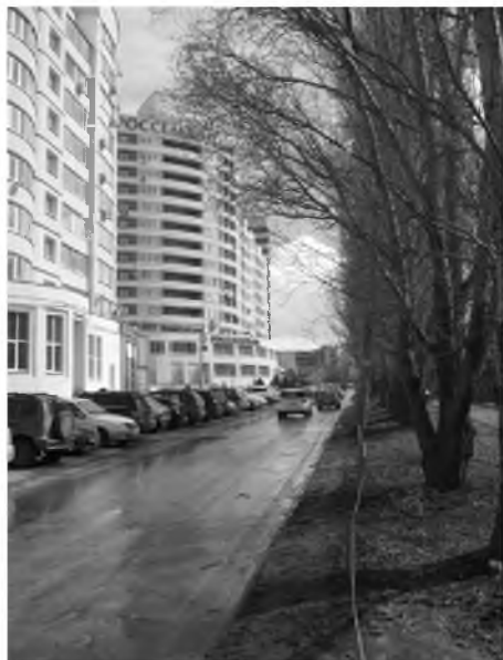
Улица академика С.Ф. Платонова в Самаре