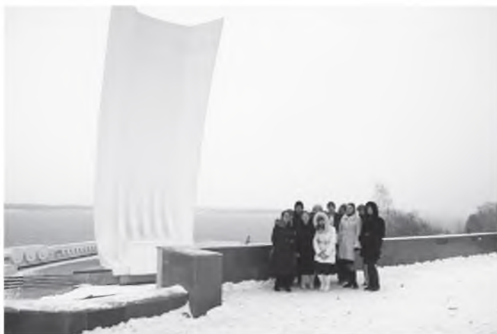
Участники Чтений у Лады