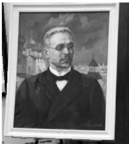
Портрет академика С.Ф. Платонова. Художник Ю.И. Филиппов