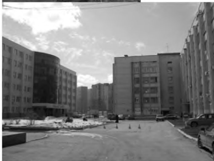
Внутренний дворик Самарского государственного университета. Вид с ул. С.Ф. Платонова