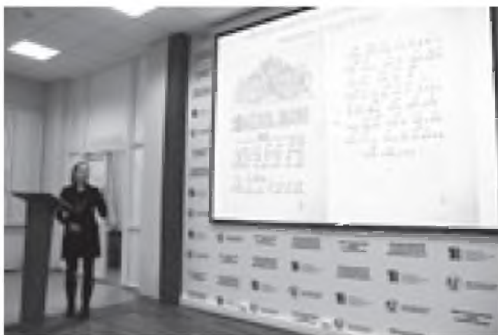
XX Всероссийские Платоновские чтения – 2014 г.