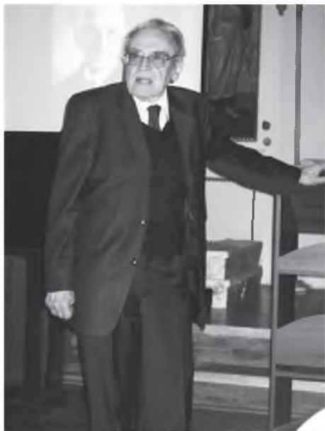
Юбилейная конференция, посвященная 150-летию С.Ф. Платонова. Санкт-Петербург, 2010 г.