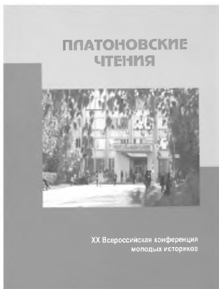
Один из сборников