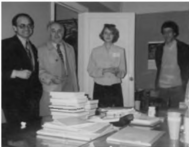
Фотографии из истории проведения Платоновских чтений. У истоков конференции – 1997 г.