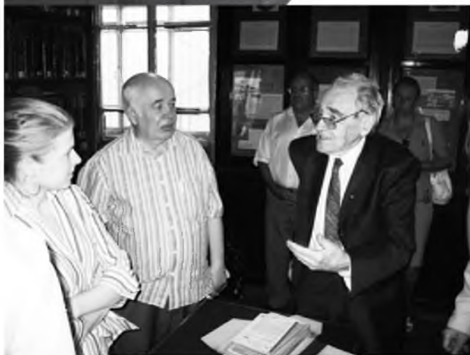
Академик Сигурд Оттович Шмидт с участниками конференции. Санкт-Петербург, 2010 г.