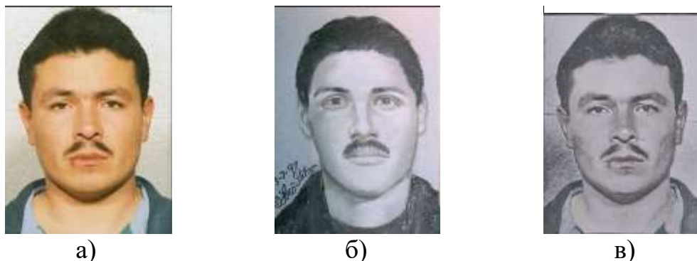
Рис.2. Примеры изображений тестового набора данных – а) портретное натуралистическое изображение, б) набросок того же человека, в) портретное изображение после переноса стиля наброска. Мера близости между изображениями а) и б) – 0,5821, между в) и б) – 0,5795.