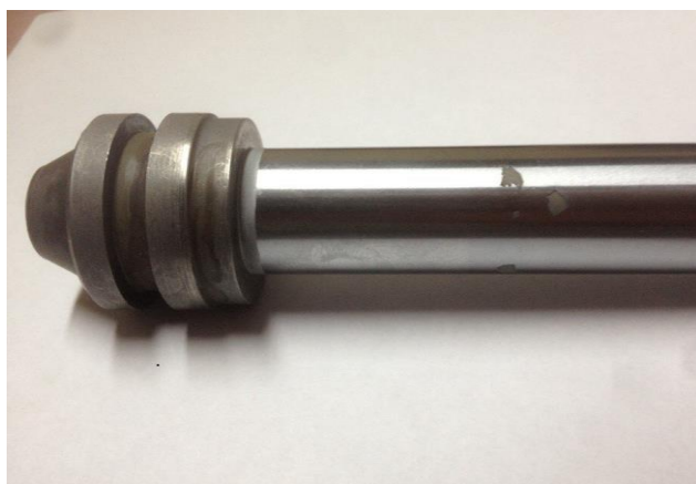
Рисунок 1 – Шток из материала ВТ3-1 с дефектами хромового покрытия