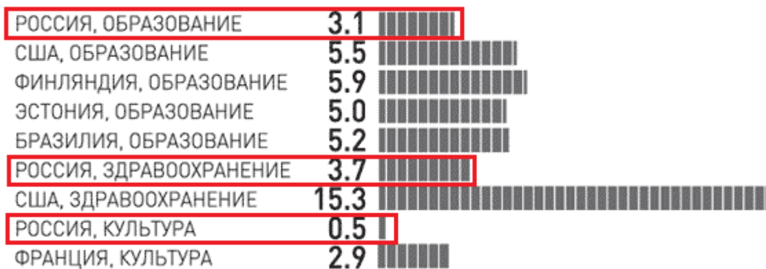
Рисунок 1 - Инвестиции в человеческий капитал, % от ВВП страны [4]

С 2018 года внедрена система оценки индекса человеческого капитала, принятая на международном уровне. Расчет индекса производится с целью реализации унифицированного подхода к анализу социально-экономического развития. Выявление приоритетных траекторий устойчивого развития осуществляется через выявление закономерностей инвестирования в человеческий капитал и развитие наукоёмких отраслей. В основу методики расчета индекса соотношение уровня рождаемости с достижением населения дееспособного возраста, соотношение продолжительности и качества полученного образования к трудоспособному возрасту, а также уровень состояния здоровья трудоспособного населения.