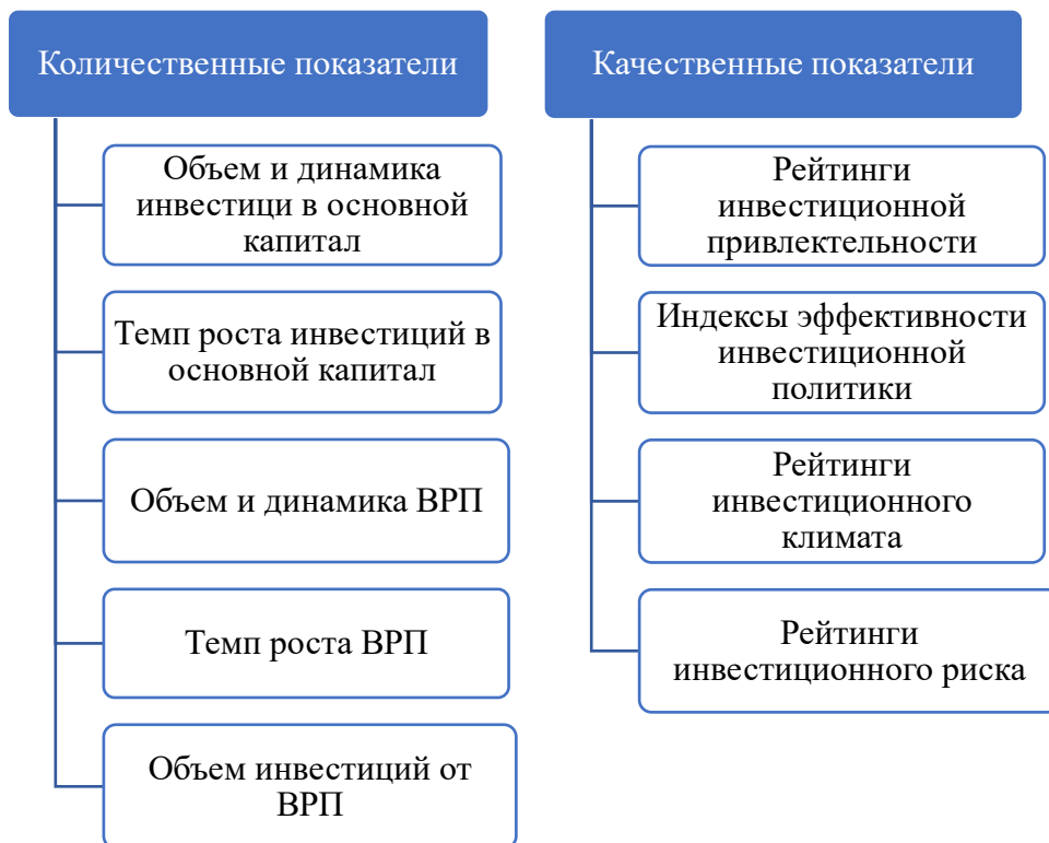
Рисунок 1 — Качественные и количественные показатели, отражающие эффективность инвестиционной политики региона

Как видно из рисунка 1 существует достаточно большое количество показателей, с помощью которых можно оценить эффективность проводимой инвестиционной политики в регионе. Наиболее объективными показателями являются количественные показатели. Именно они отражают реальные изменения от инвестиционной политики. Качественные показатели являются менее объективными и необходимы для выявления причинно-следственной связи [5]. Говоря об объеме инвестиции в регионе, качественные показатели отражают причину, по которой происходят те или иные изменения. Количественные показатели являются следствием изменений, которые были даны при качественной оценке.