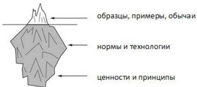
Рис. 1. Модель айсберга культуры Э. Холла

сторону культуры» (1976 г.) 32 . В данной модели все аспекты культуры делятся на видимые (находящиеся над водой), полувидимые и невидимые (рис. 1).