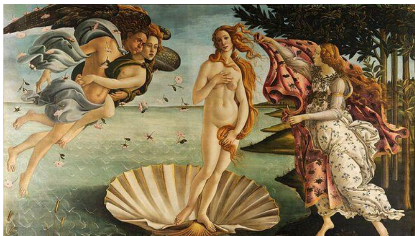
Рис. 5. Сандро Боттичелли «Рождение Венеры». 1482 г.

Один из первых постмодернистов, основатель поп-арта Энди Уорхол (1928–1987), разрушает границы между элитарным и массовым, искусством и повседневностью, ставит знак равенства между классическим образом Венеры Боттичелли (рис. 5), портретом поп-звезды или изображением банки супа.