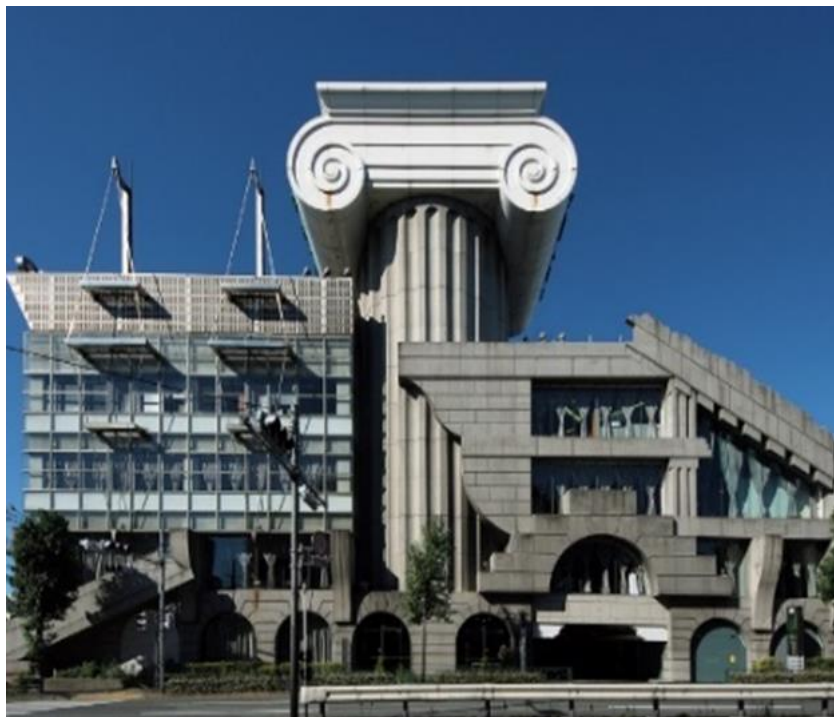
Рис. 9. Здание шоу-рума «M2» в Токио. Архитектор Кума Кэнго. 1991 г.

Принципы обращения к культурному наследию в архитектуре постмодернизма воплотило в себе здание шоу-рума M2 в Токио (архитектор Кума Кэнго, рис. 9).