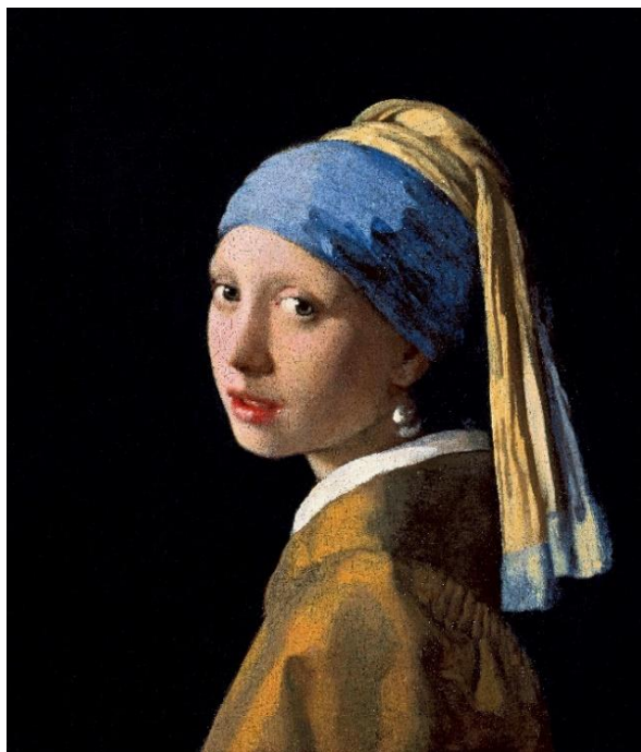
Рис. 7. Ян Вермеер «Девушка с жемчужной сережкой». Ок. 1665 г. Маурицхейс, Гаага

где хранится картина Вермеера, предложил поклонникам создать свои версии картины и устроил их виртуальную выставку на своем сайте и в социальных сетях 68 .