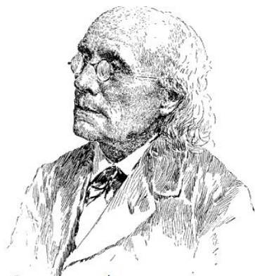
Основатель психофизики Густав Теодор Фехнер (1801 - 1887)

В 1860 году он публикует работу «Элементы психофизики», в которой даётся описание предмета и методов психофизики.