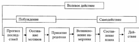
Схема этапов волевого действия