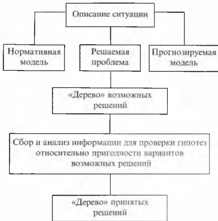
Рис. 1. Логика прикладного исследования

«Прогнозируемая модель» означает возможное состояние ситуации (его прогнозирует социолог) в случае, если никакие меры по ее изменению не будут приняты.