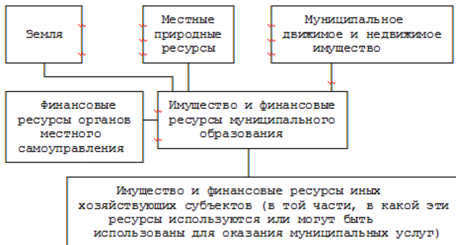
Рис. 2. Имущество и финансовые ресурсы муниципального образования

зубые в экономической деятельности. В настоящей главе рассматриваются вопросы управления имущественными и финансовыми ресурсами муниципального образования, которые, согласно Федеральному закону 2003 года, составляют экономическую основу местного самоуправления. Перечень этих ресурсов приведен на рис. 2.