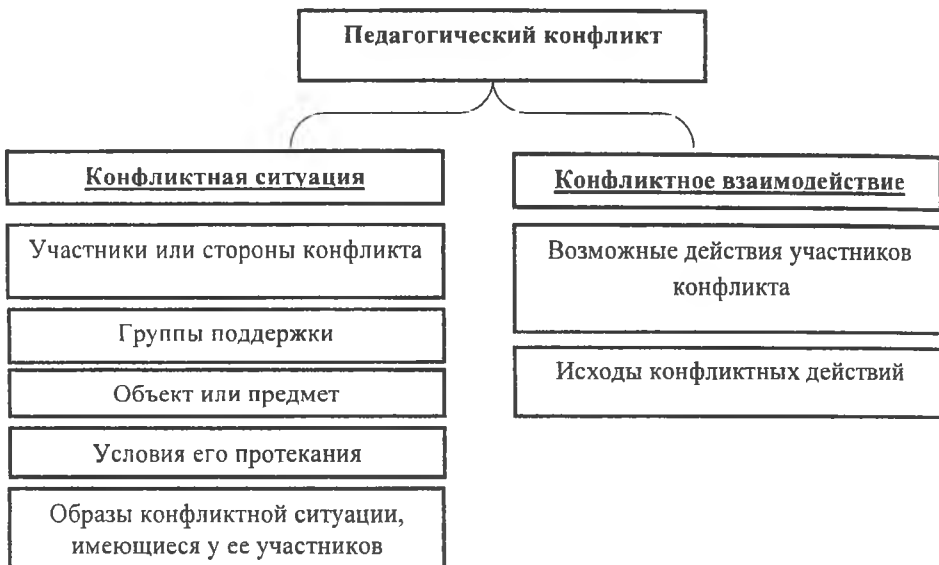
Рис. Структура педагогического конфликта (А.Я. Анцупов, А.И. Шипилов)

Образ конфликтной ситуации — это отображение предмета конфликта в сознании субъектов конфликтного взаимодействия. Образы конфликтной ситуации, которые иногда называют своеобразными идеальными картами ситуации, включают следующие элементы: